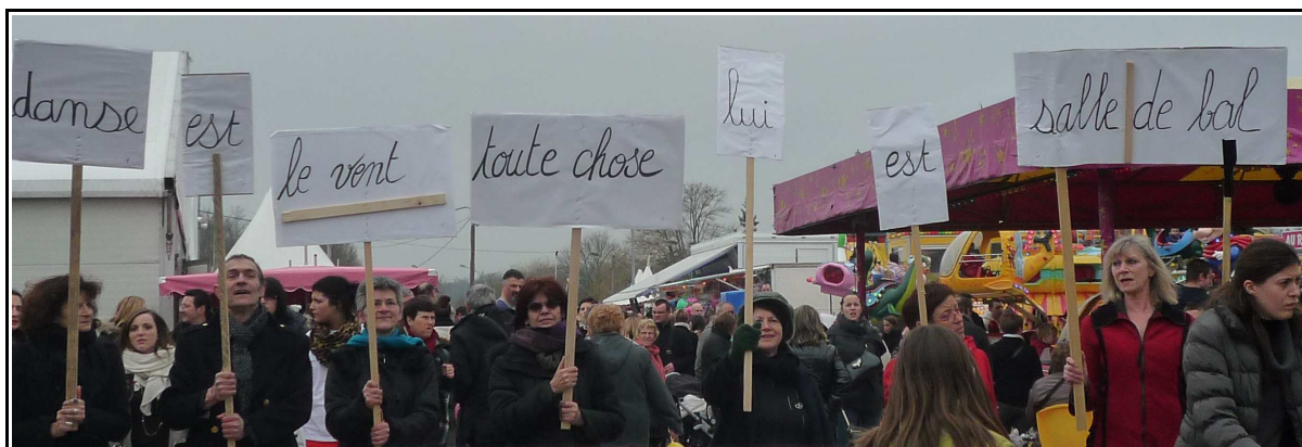
Manifestation poétique - Foire aux fromages de Coulommiers – Mars 2013

Danse est le vent toute chose lui est salle de bal Adonis