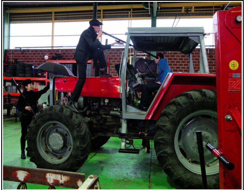
Pratiques de l'effraction de la parole – Lycée Georges Cormier – Novembre 2012