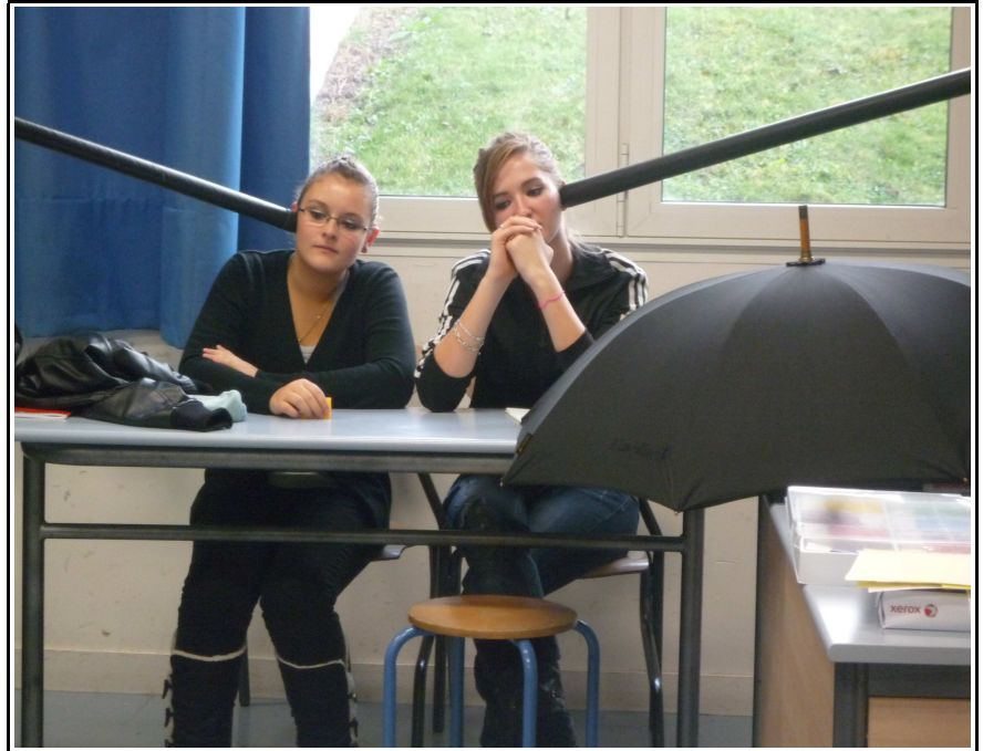
Pratiques de l'effraction de la parole – Collège La Fayette – Décembre 2011

Lors des Pratiques de l'effraction de la parole , les Souffleurs se déploient silencieusement dans les établissements, et, tout doucement, ouvrent les portes des classes, pénètrent tendrement à l'intérieur des salles et offrent quelques minutes de stupéfaction poétique aux personnes en train de travailler. Ces interventions replacent le silence au centre même du processus d'élévation et de concentration. Le silence des Pratiques de l'effraction s'impose de lui-même, l'écoute devient source de plaisir. L'écoute est un partage.