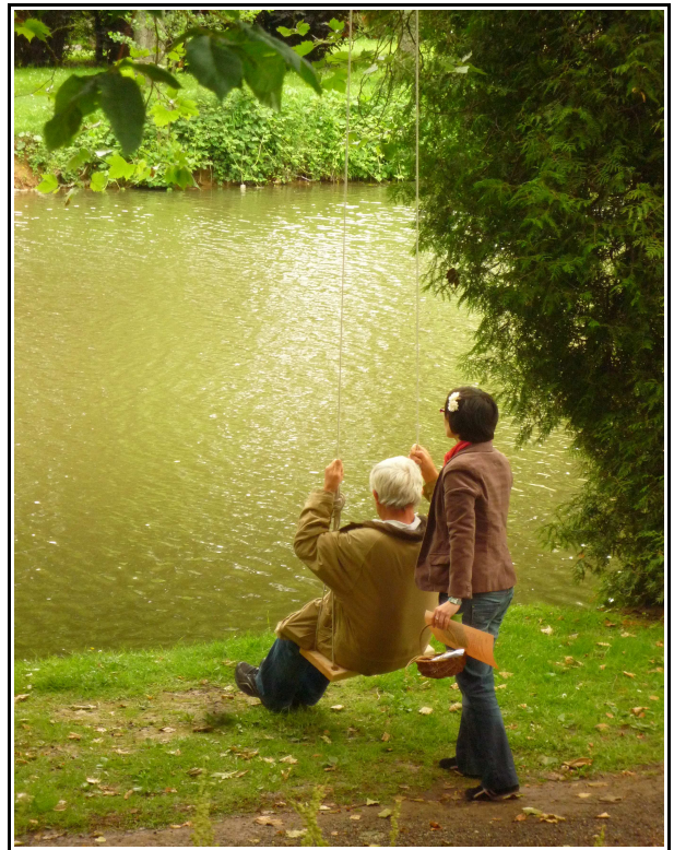
Promenade poétique - Parc des Capucins – Juin 2012

[Manufacture des regards poétiques portés sur la ville]