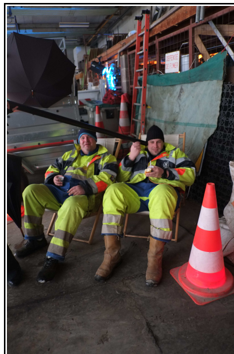
Petits privilèges aux hommes de l'ombre Centre technique municipal de Coulommiers – Février 2013