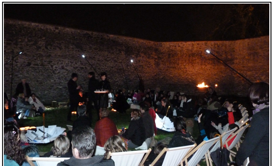
Bivouac printanier poétique sous les étoiles - Bibliothèque de Coulommiers – Mars 2012

[Participation artistique aux événements municipaux]