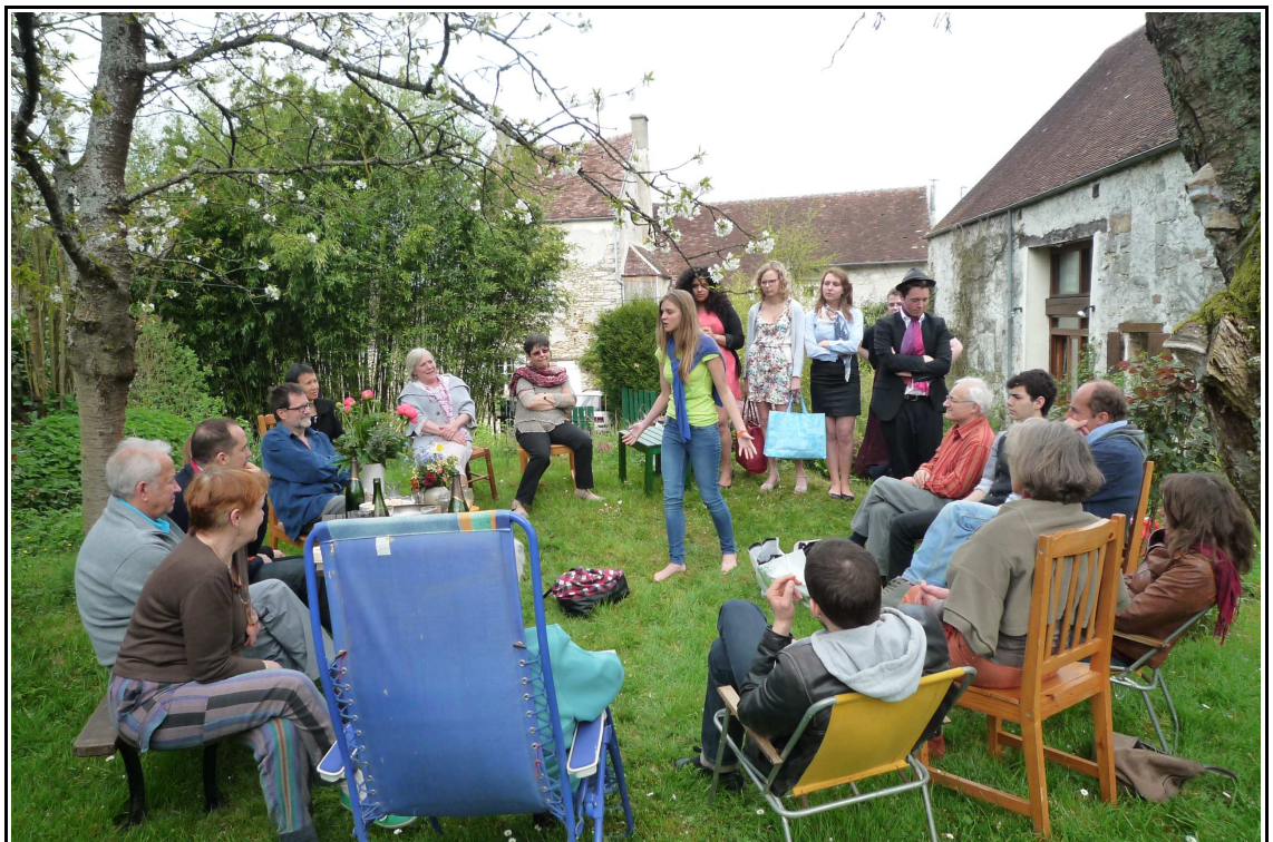
Petit Salon des tendresses voyageur - Avril 2014 Tournée avec l'option théâtre du lycée Jules Ferry

[Le Petit Salon des tendresses voyageur] c'est, à la manière des commerçants ambulants qui sillonnaient le territoire pour approvisionner les personnes isolées des produits de première nécessité, une épicerie poétique ambulante.