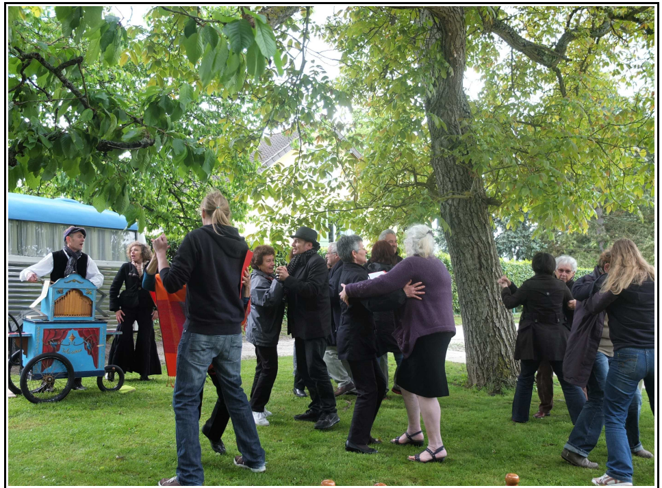
Fiançailles des étourdis chez « Mado » - Chailly-en-Brie – Mai 2013

Le Petit Salon des tendresses voyageur c'est, à la manière des commerçants ambulants qui sillonnaient le territoire pour approvisionner les personnes isolées des produits de première nécessité, une épicerie poétique ambulante. En 2013, neuf habitants du canton ont pris secrètement rendez-vous avec les Souffleurs et le service culturel de la ville. Ils ont accueilli leurs voisins, leurs amis, leur famille à trois reprise (en avril, mai et juin), dans leurs logements, et leur ont offert une surprise poétique au beau milieu d'un repas, d'un petit déjeuner ou d'un apéritif. Près de cent soixante dix personnes ont ainsi pu : faire des exercices de théâtre en avril ; danser et écouter des lectures en mai ; s'allonger dans l'herbe ou sur un transat et écouter des secrets poétiques et littéraires en juin.