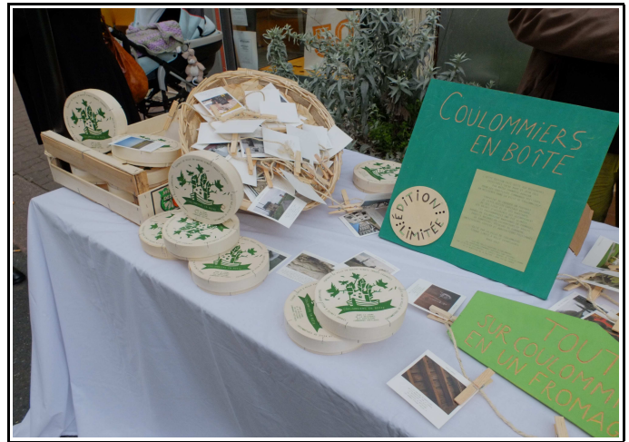
Commando fromager – Stand de Coulommiers en boite sur le marché Septembre 2012