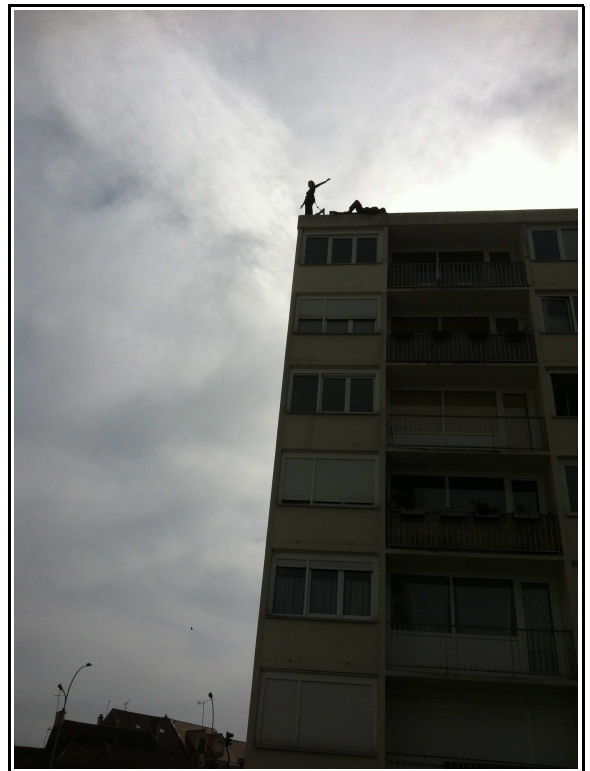
Les Regardeurs – Avril 2014 Résidence de création à Coulommiers

Le Regardeur est un artiste placé en situation de vertige et en veille étymologique sur le tranchant acéré des crêtes de nos buildings. Il marque le grand corps de la ville comme une aiguille d'acupuncteur et ausculte les flux énergétiques de nos cités travaillées par l'activité humaine.