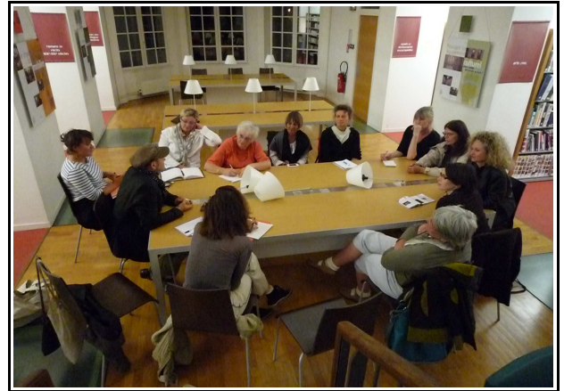
Réunion des Poétiques Sentinelles Manufacture des regards poétiques portés sur le territoire Septembre 2011