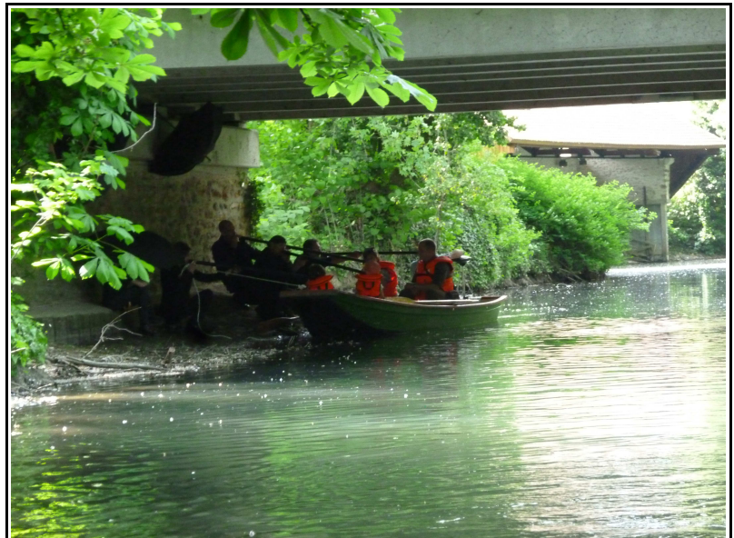
Marquages poétiques sur le Morin – Mai 2011

Parallèlement à ce travail d'approche, les Souffleurs commandos poétiques se sont présentés aux Columériens en de multiples occasions.