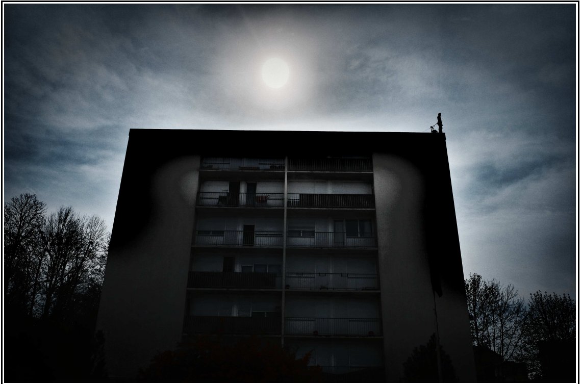
Les Regardeurs – Avril 2014 Résidence de création à Coulommiers

(...) qu'un trait conducteur surgisse, s'impose, s'évapore, à n'être jamais la ligne d'horizon qui sépare, mais la ligne de crête, la dentelle de granit qui, de proche en proche, nous hèle, nous tire, nous éclaire.