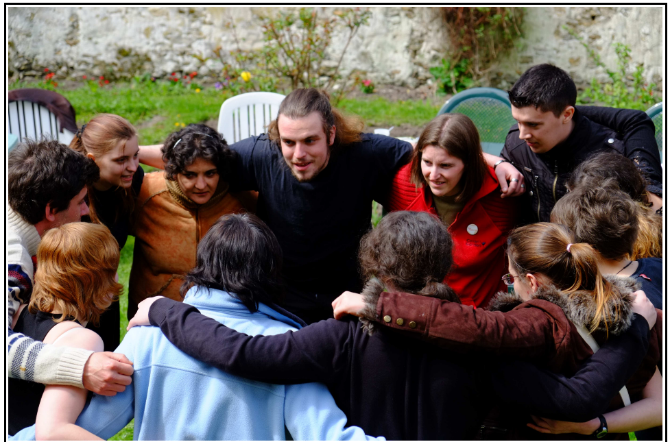
Petit salon des tendresses voyageur - avril 2013 Appartements thérapeutiques Erasme

Ces paysages dans lesquels on devrait pouvoir à l'instant plonger les yeux et ne plus rien trouver d'habituel ensuite autour de soi.