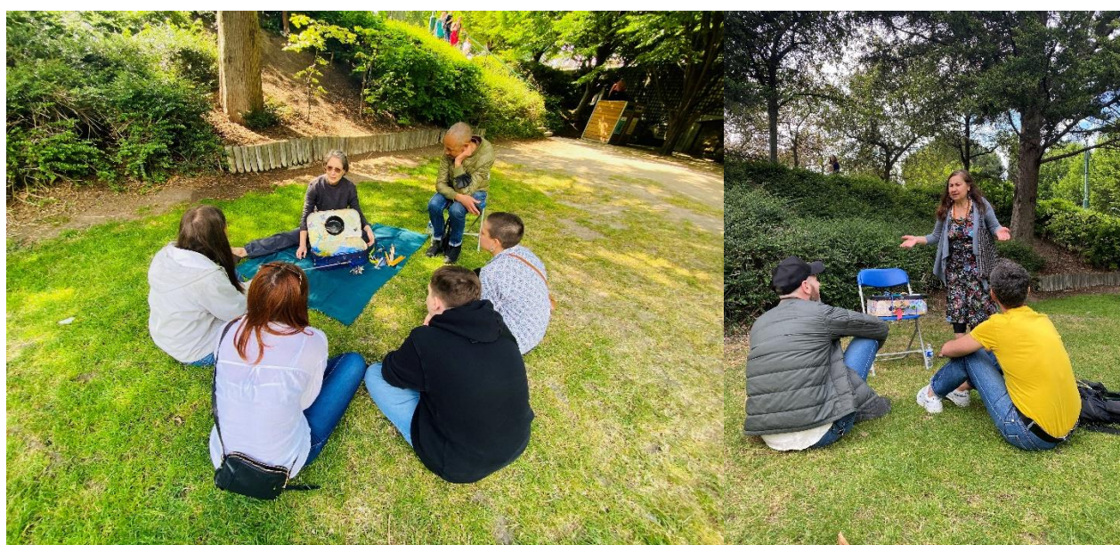
Le Chant des vagabondes