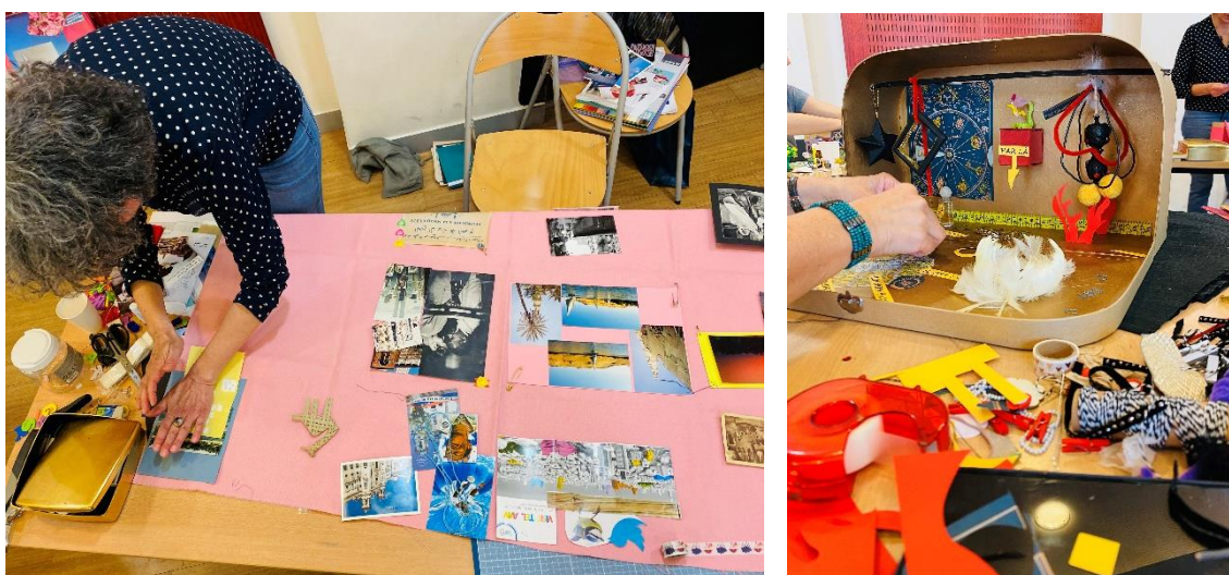
Le Chant des vagabondes